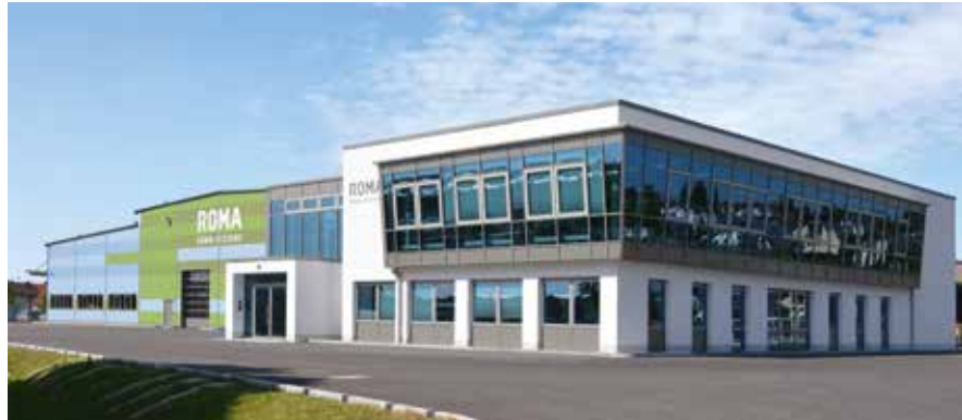
Unternehmensbereich Zellen, Türen und Kammern

Wir entwickeln und fertigen Kühl- und Tiefkühlzellen und die hierfür passenden Türen. Darüber hinaus Klimakammern, Reinräume und Spezialräume für eine Vielzahl klimatechnischer Anwendungen. Über 70 Jahre Erfolg und Erfahrung in diesen hoch spezialisierten Bauelementen sprechen für sich. Von Anfang an produziert unser Familienunternehmen in Deutschland – eben Qualität made in Germany.