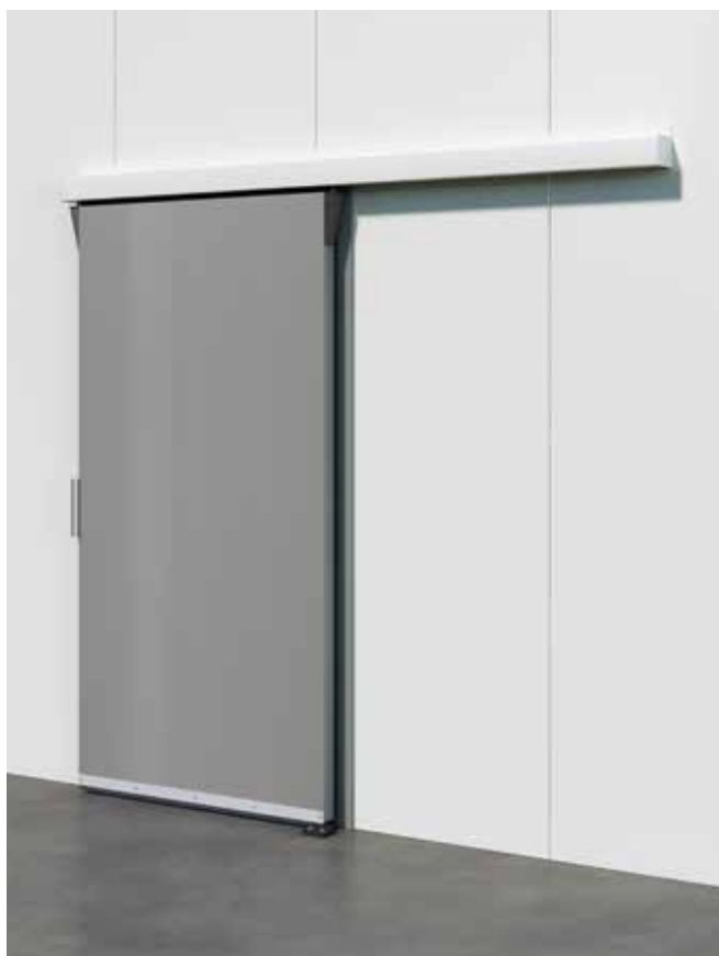
Kühlraum-Schiebetür in Sonderfarbe RAL 7005