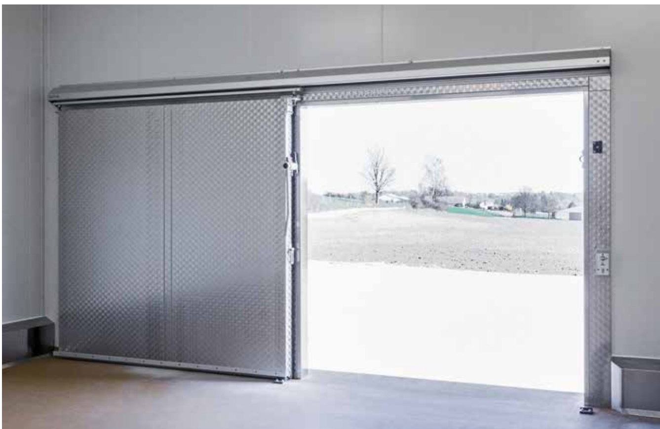
Schiebetür in Edelstahl