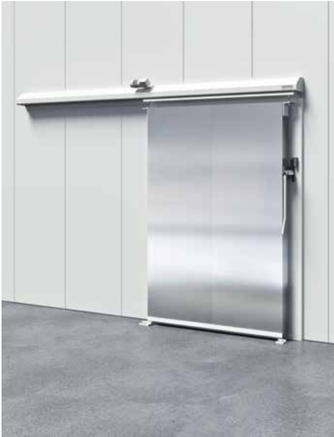
Schiebetür in Edelstahl für Kühl- und Tiefkühlräume mit E-Automatik